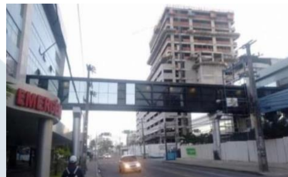
ESPERANÇA DE OLINDA