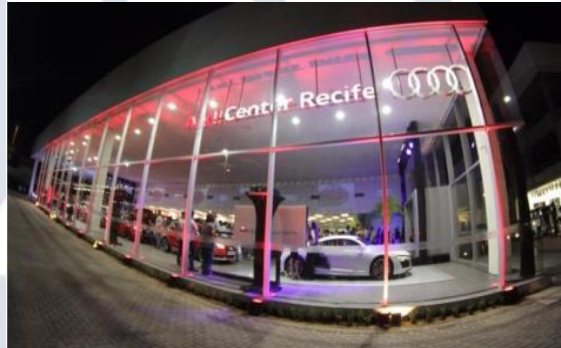
AUDI – BOA VIAGEM