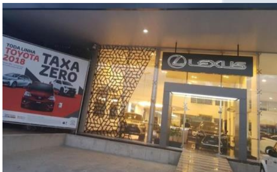
LEXUS - IMBIRIBEIRA