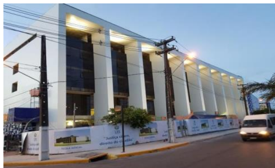
ESMAPE - TJPE