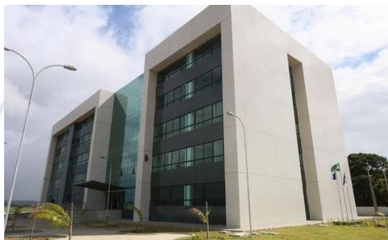
FÓRUM – SERRA TALHADA