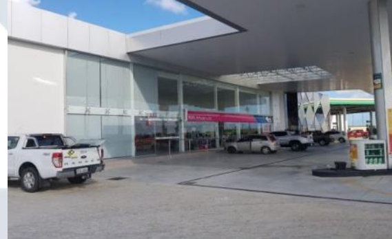
POSTO MARIA DE LOURDES III