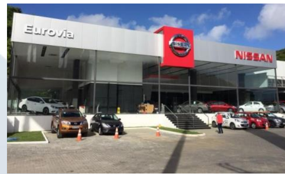
EUROVIA NISSAN - SALVADOR